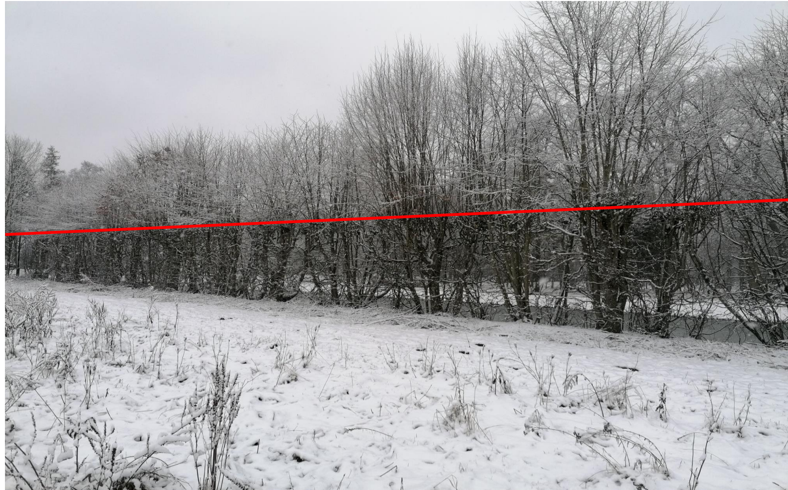
Zdjęcie nr 1 czerwona linia – zakres cięcia przywracających formę

Muzeum Narodowe w Warszawie Oddział Muzeum w Nieborowie i Arkadii Aleja Lipowa 35 99-416 Nieborów 46 838 56 35 sekretariat@nieborow.art.pl www.nieborow.art.pl