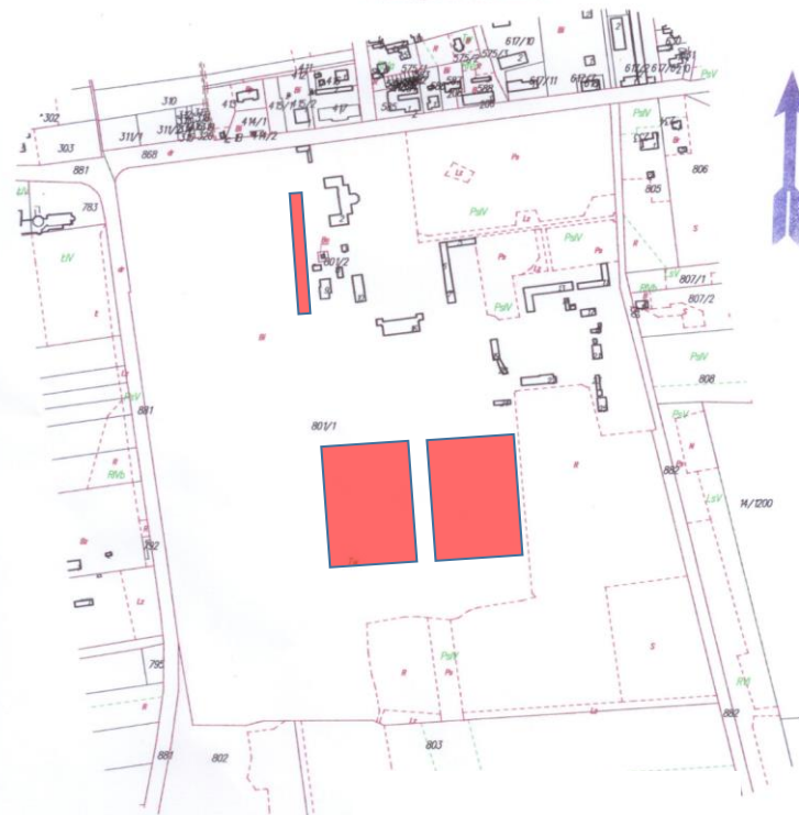
Wycinek mapy ewidencyjnej gm. Nieborów, obręb Nieborów skala 1:5000

Muzeum Narodowe w Warszawie Oddział Muzeum w Nieborowie i Arkadii Aleja Lipowa 35 99-416 Nieborów 46 838 56 35 sekretariat@nieborow.art.pl www.nieborow.art.pl